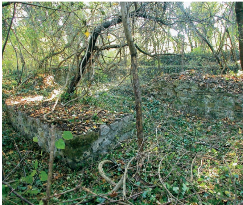
Današnji izgled istraženih ostataka utvrđenja u Čortanovcima Present day appearance of the investigated remains of the fortification in Čortanovci

je poznat – možda je bio Ad Hercule ili Kastrum Hercule. Najnovija rasprava na osnovu antičkih itinerera i rasporeda šančeva na bačkoj strani sugerišu da je ovde mogao biti Akuminkum, sedište legije i dela rečne flote. U široj okolini evidentirani su rimska nekropola, ostaci vile rustike kao i srednjovekovno naselje i nekropola. Najznačajnija je ostava rimskog novca, koja sadrži oko 2.300 komada. Pronađena je 1932, a od 1933. čuva se u Narodnom muzeju u Beogradu.